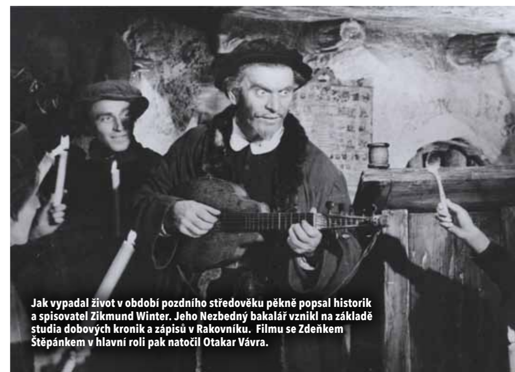
Jak vypadal život v období pozdního středověku pěkně popsal historik a spisovatel Zikmund Winter. Jeho Nezbedný bakalář vznikl na základě studia dobových kronik a zápisů v Rakovniku. Filmu se Zdeňkem Štěpánkem v hlavní roli pak natočil Otakar Vávra.