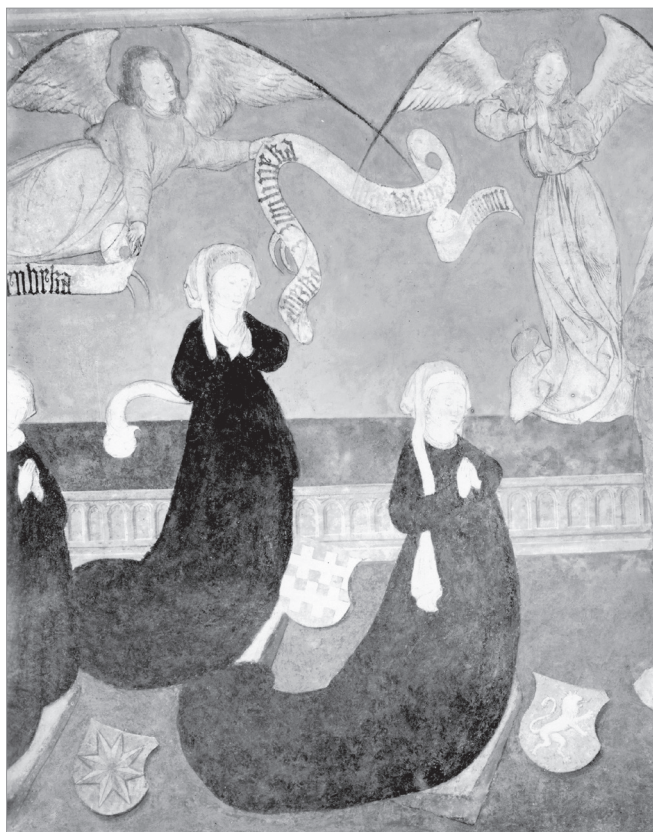
(4) Jindřichův Hradec, zámecká kaple Božího těla, votivní obraz Jindřicha IV. z Hradce, detail jeho manželek, 1485–1493.