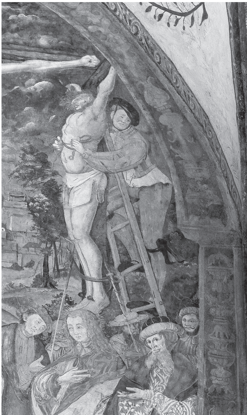
(2) Kadaň, klášter františkánů-observantů, kostel Čtrnácti sv. pomocníků, jižní stěna presbytáře, výjev Ukřižování, detail orámování s kandelábovým dekorem, krátce před 1517.