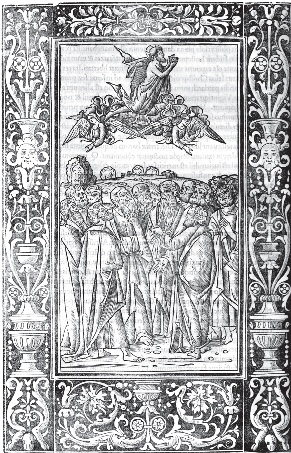
(3) Marcus VIGERIUS, Decachordum Christianum , [s. l.] 1507.