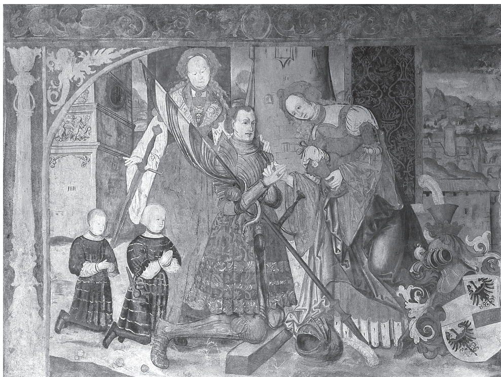
(6) Kadaň, klášter františkánů-observantů, kostel Čtrnácti sv. pomocníků, jižní stěna presbytáře, votivní obraz Jaroslava II. z Lobkovic, detail levé poloviny, krátce před 1517.

neodpovídá věk chlapců na malbě. 23 Jaroslav II. měl podle stručné zprávy o jeho rodině, zařazené za spis K správě a naučení synu Jaroslavovi , 24 celkem šest synů, z nichž čtyři zemřeli v dětském věku. Když vyloučíme Albrechta, který spolu se sestrou zemřel hned po křtu, můžeme určit roky, kdy měl Jaroslav dva syny: v roce 1504 (Jan III. /*1503/ a Jindřich /*1504, † ještě téhož roku/), snad v letech 1505–1506 (Jan III. a Levin /1505–1507/), snad 1507–1511 (Jan III. a Jindřich) nebo po roce 1511 (Jindřich a Šebestián). Nejistotu do uvedených údajů vnáší fakt, že u prvního syna Jana neznáme rok úmrtí. Jako jediný korektiv širokého datačního rozptylu spodního pásu malby mezi léta 1504 a 1531 se kromě výtvarné stránky, kterou na tomto místě nechávám stranou, 25 jeví věk zobrazených chlapců. 26 Větší z nich má