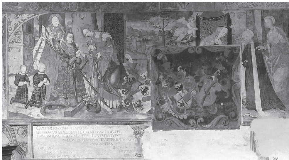
(1) Kadaň, klášter františkánů-observantů, kostel Čtrnácti sv. pomocníků, jižní stěna presbytáře, votivní obraz Jaroslava II. z Lobkovic, krátce před 1517.

rozsahech a výjimečnou kvalitou nenacházejí období nejen v prostředí františkánské observance, ale ani v dobovém umění českých zemí jako celku, snad jen s výjimkou pražské Svatováclavské kaple. Hlavní scény představují Ukřižování a Oplakávání, k nimž se dole přimyká votivní scéna s objednavateli a svěťci.