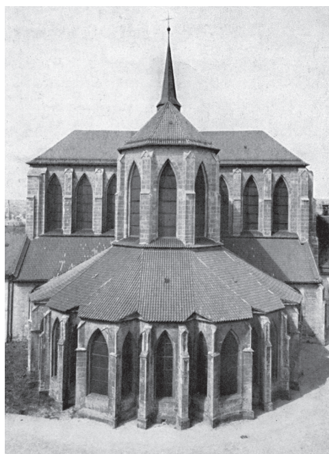
(2) Sedlec u Kutné Hory, konventní kostel někdejšího cisterciáckého kláštera v pohledu od východu.

stříbrných dolů, tak úzkých vztahů ke královskému dvoru a svému konventu, dosud soukromému založení, tímto krokem získal prestiž zeměpanského duchovního ústavu. V jistém smyslu šlo o vyvrcholení Heidenreichových snah o povznesení sedleckého kláštera za jeho působení. Ambicím a úmyslům Heidenreicha i Václava odpovídaly formy i dimenze, ve kterých měl být nový klášterní kostel vybudován: architektonické kvality stavby i vysoká úroveň sedlecké stavební huti a mistrů stojících v jejím čele jsou evidentní, jakkoli původ sedleckých kameníků a konkrétní osobnost architekta (či architektů) sedlecké konventní baziliky určitějším uchopení zatím unikají. 32 Právě monumentalita a zvolené formální utváření klášterního chrámu Panny Marie v Sedlci prokazují, že jeho stavba byla dlouho promyšlenou a plánovanou realizací, ve které oba hlavní protagonisté demonstrovali na straně jedné řádovou spiritualitu i sepětí cisterciáků se západoevropskými kulturními centry, na straně druhé dynastický, královský majestát a zbožnost. V tomto ohledu zpráva z roku 1304 potvrzuje postřehy o sedlecké gotické klášterní bazilice jako o reprezentativní monastické – specificky cisterciácké, stejně tak ale královské architektuře (obr. 2). 33