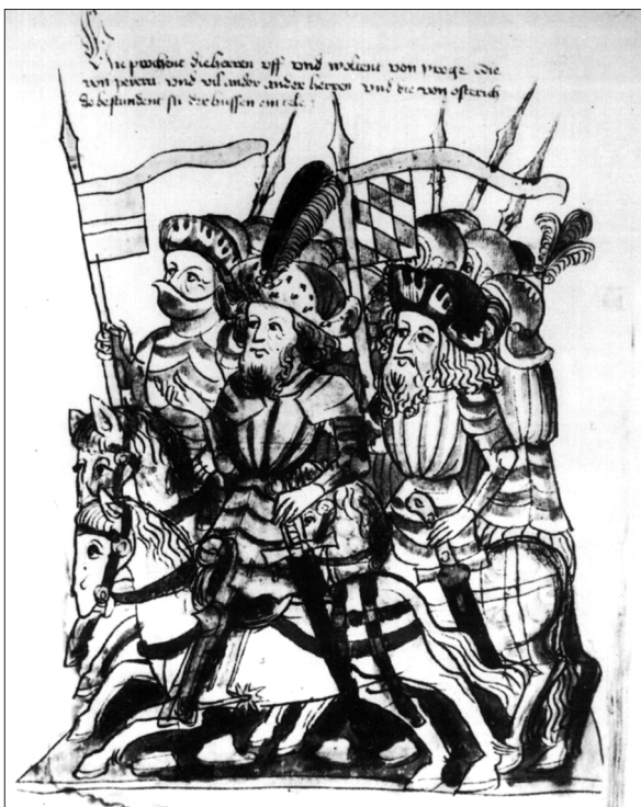
Tažení rakouských vévodů, kteří měli Oldřichovi z Rožmberka pomoci s dobýváním Tábora, zachytil ilustrátor kroniky Eberharda Windecka Pamětihodnosti k dějinám doby císaře Zikmunda z roku 1443 (rakouská korouhev vlevo).

Určité nejasnosti panují ohledně délky Mikulášova přesunu, neboť k Táboru dospěl až 30. června. Přestože kvůli utajení nejel nejkratší cestou a patrně vždy až po setmění, pět dní na přesun jízdního oddílu se, zejména v této kritické chvíli, jeví jako dlouhá doba. Možná však bylo načasování útoku na 30. červen záměrné, neboť tento den připadl na neděli, tedy sváteční den, kdy měl být tělesný boj zapovězen. Netřeba si jistě dělat iluze ohledně předepisovaného nábožného rozjímání, co bylo ale důležitější, že ostražitost před svátečními dny často klesala, což mohlo jít i na vrub vyšší spotřeby alkoholu. Nedělní případy byly z tohoto důvodu husity velmi oblíbené, byť právě jejich kněží k správnému trávení nedělí nejvíce nabádali. 22 Ať již však Mikulášovo zdržení způsobil taktický plán, či nikoli, za úsvitu 30. června obléhatele napadl a s pomocí tábořských bratří uvnitř hradeb mnohonásobně silnějšího nepřítele přemohl.