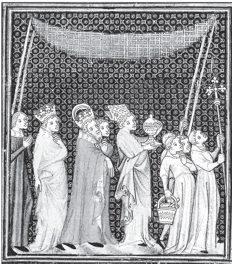
4. Při své návštěvě Francie se musel Karel IV. baldachýnu s císařským znakem, podobně jako dalších symbolů, které by mohly vyjadřovat jeho nadřazené postavení nad francouzským králem, vzdát. Vyobrazení z Velkých francouzských kronik upomíná na hlavní význam latinského pojmu baldakinus, vzácnou látku (zde červené barvy) prošívanou zlatem.